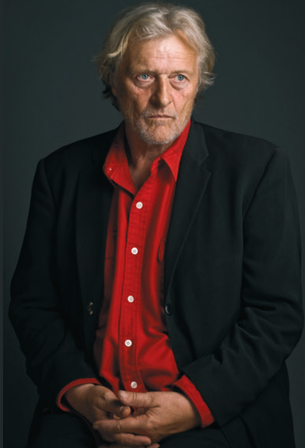
Koos Breukel, Rutger Hauer (1944) acteur 2009 100 x 67 cm inktjet print