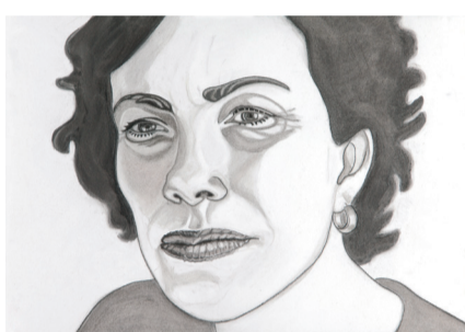
Rosemin Hendriks, Zonder titel 2013 66,4 x 49,5 cm houtschool, pastel en conté